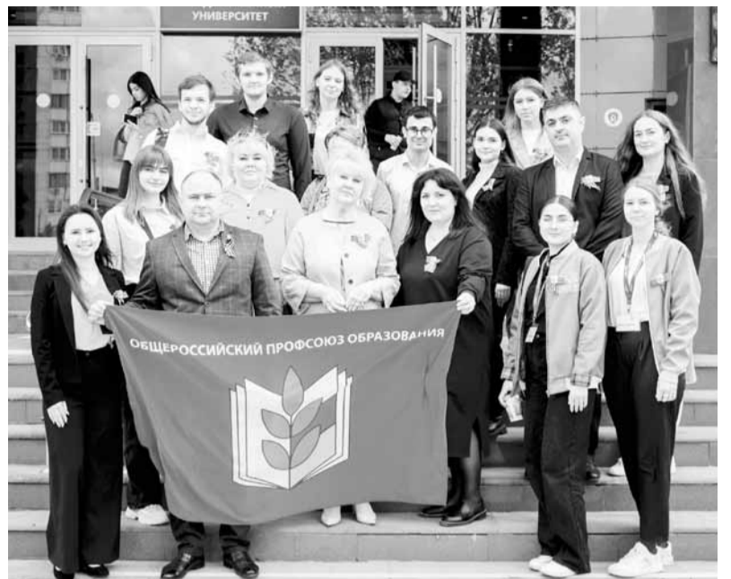
Участники встречи у стен Пятигорского государственного университета