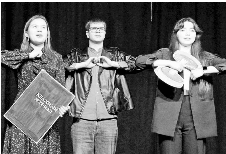
Репетиция спектакля «Все будет просто здорово!» в школе №293