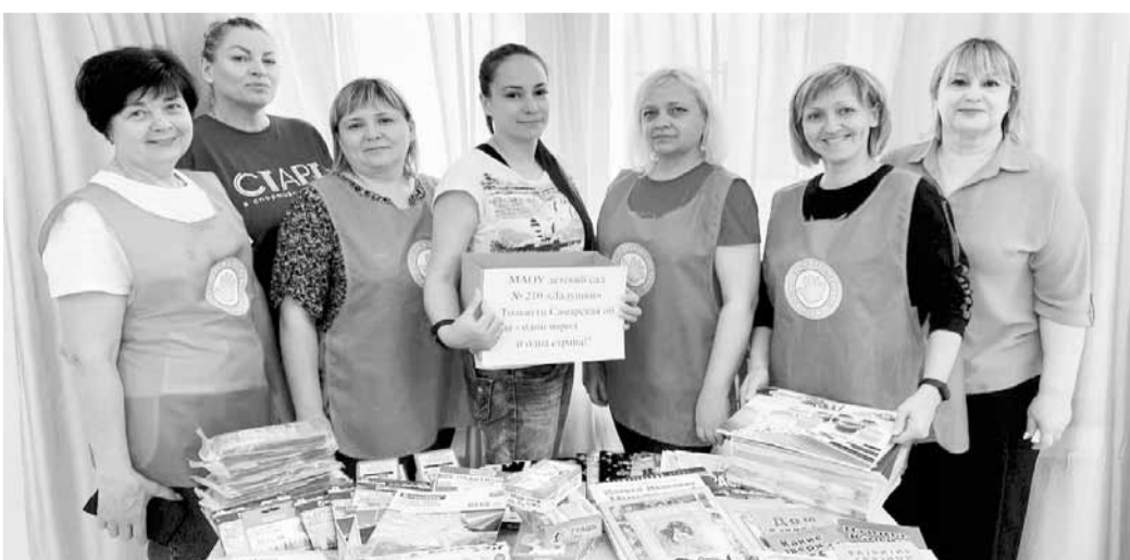
Книги и канцтовары для детей из города Снежное ДНР