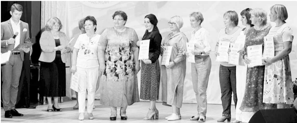
Самые активные волонтеры получили награды

Исследовательская акция «Маяк для многих поколений» посвящена ветеранам образования, их успехам и достижениям. Многие ее участники и