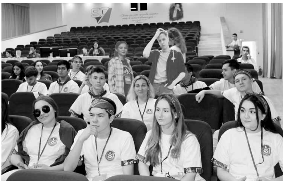
Зв происходящим на сцене внимательно наблюдали болельщики