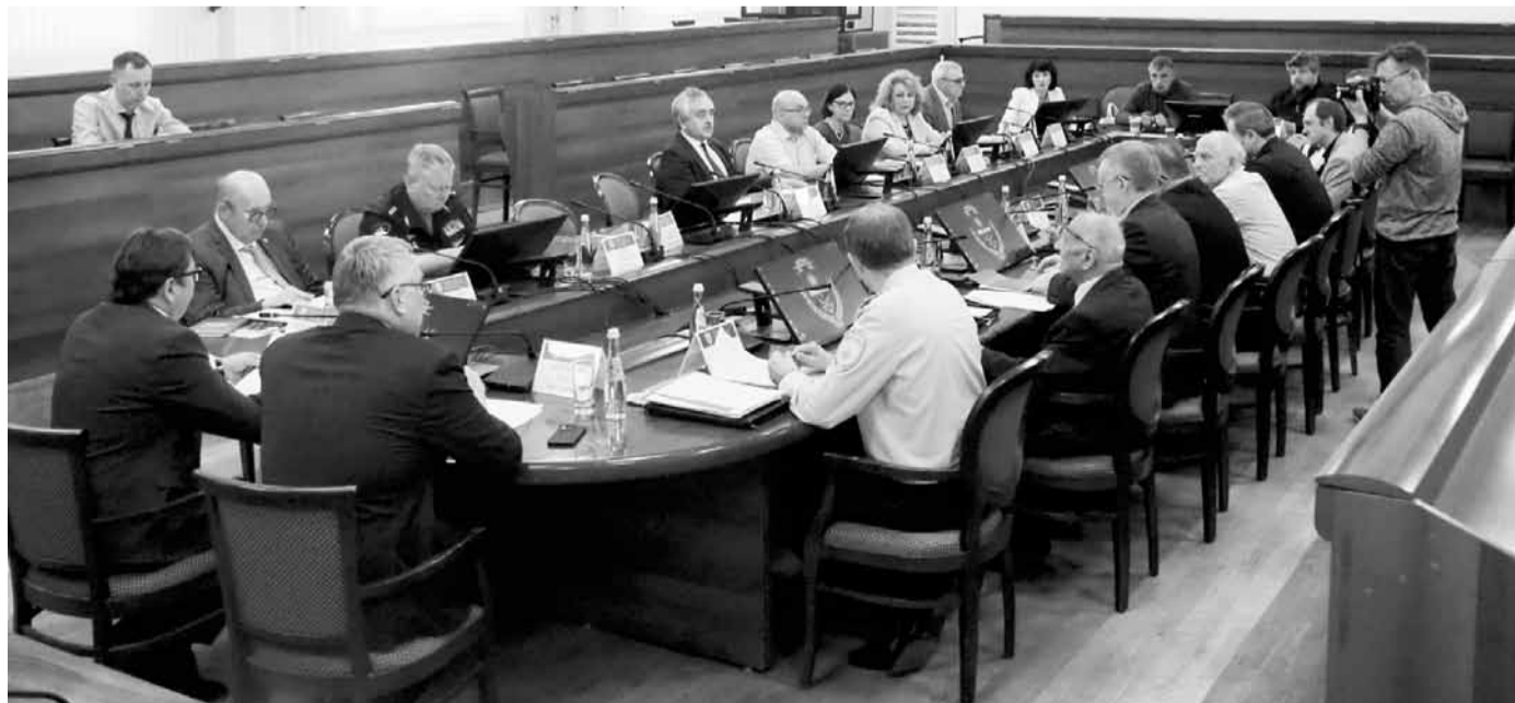
Идет заседание Совета ректоров

Также дети медицинских работников, погибших в результате инфицирования COVID-19 при исполнении трудовых обязанностей, в пределах отдельной квоты смогут поступать без вступительных испытаний на бюджетные места в вузы по программам медицинского и фармацевтического образования.