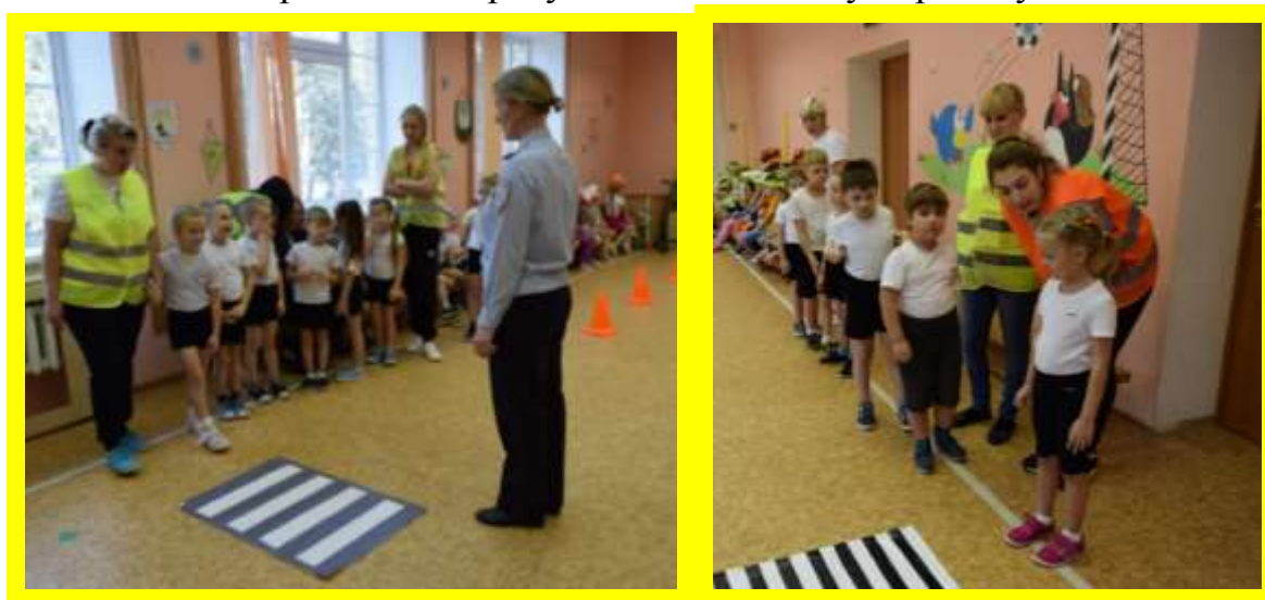
Сначала надо посмотреть налево, а потом направо!

Позаботься о себе – Будь заметным в темноте!!!